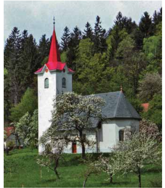
Cerkev sv. Katarine z novo streho.

Večina so to namenski darovi, ki jih dobrotniki prinesejo v župnišče. Nekaj je darov ob pogrebih namesto cvetja na grob dragih. Za obnovo strehe je ves potreben les podarilo podjetje Mesec iz Kleč in s tem občutno zmanjšala strošek obnove. Pohvaliti pa želim tudi občino, ki se že več let drži podpisanega dogovora, da se del občinskega proračuna nameni za obnovo kulturnih spomenikov. Ob zaprosilu za pomoč je potrebno pripraviti projekt obnove, predračun in seveda končni račun tako, da se sredstva porabijo strogo namensko za obnovo. Brez pomoči občine bi se obnova verjetno še odložila za kako leto.