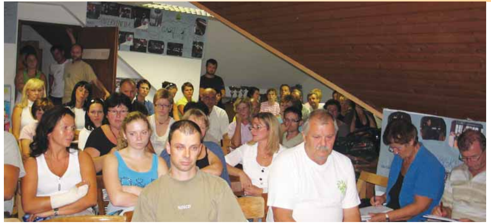
Krajani Senožet so napolnili zgornji prostor gasilskega doma Senožet in dejavno sodelovali v razpravi.