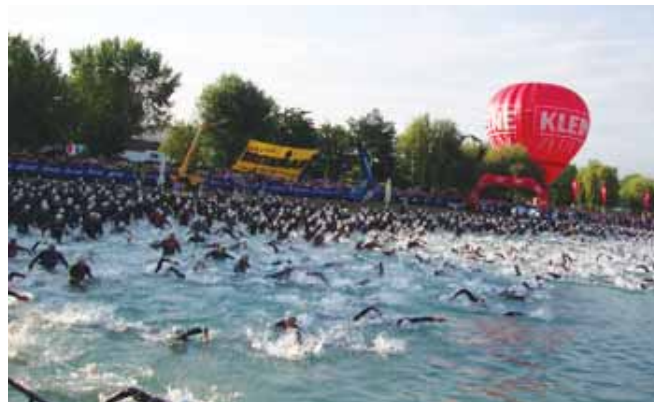
Start plavanje 3,8 km..