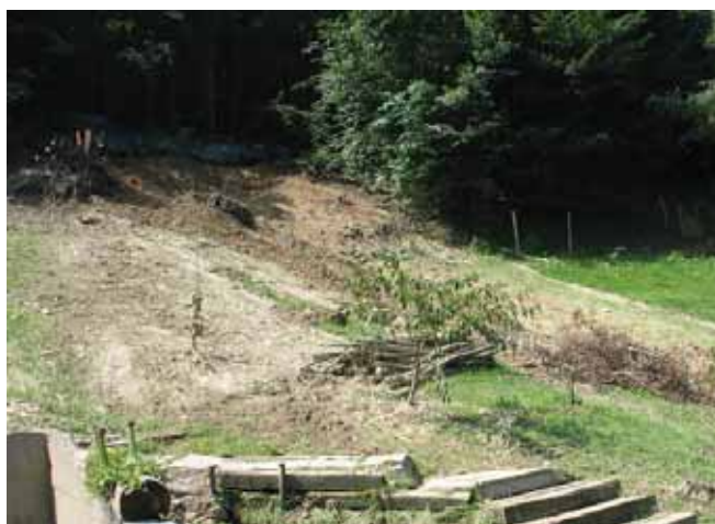
Utrgalo se je tudi tik ob hiši Lojzeta Žnidaršiča, ki zdaj vsak dan nadzira stanje terena v gozdu nad hišo. Razpoke se širijo, pravi Lojze.