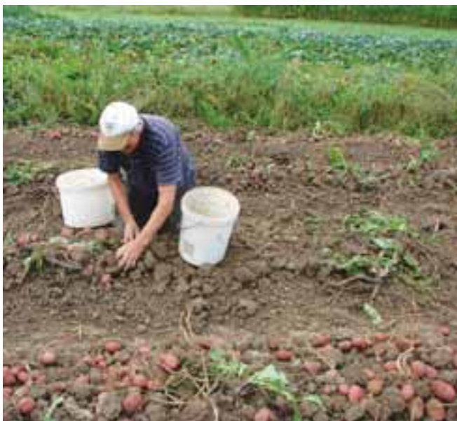
Po urah sklonjene drže se prileže prijeten pogovor ob bogato obloženi mizi.