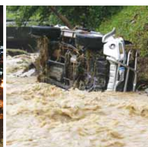
Pomoč vseh krajanov, predvsem pa članov gasilskih društev je bila neprecenljiva. Voda je vdiral v kleti in odnašale vse pred sabo, tudi avta se je znebila.