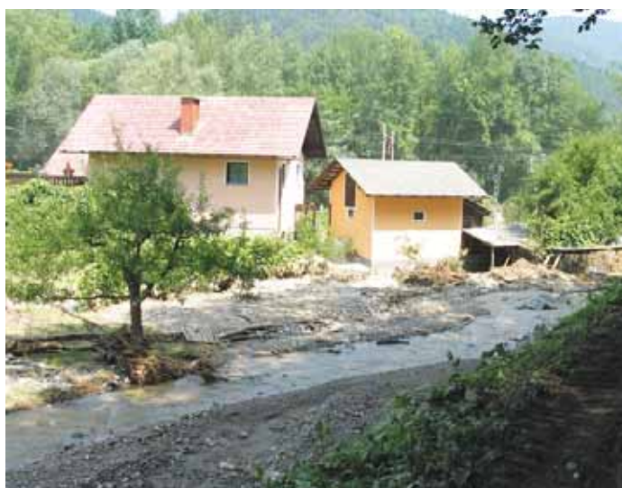
V Slapnici je bilo tudi hudo. Voda je pridrla s hriba in se okrepljena z vejevjem in hlodi znesla nad imetjem ljudi.