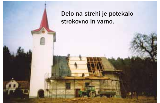
Delo na strehi je potekalo strokovno in varno.

Cerkve so kot domača hiša, nikoli dokončana zgodba. V bodoče načrtujemo ponovno pozidavo zakristije, ki je bila pred desetletji zaradi dotrajanosti in pomanjkanja sredstev za obnovo odstranjena. Načrt je že narejen. Potrebno bo tudi zamenjati staro pločevinasto kritino na zvoniku in na novo urediti drenažo, saj je cerkev postavljena na mokrem terenu. Potem bo potrebno začeti z obnovo v notranjosti, kjer že vsa oprema in zidovi kličejo po obnovi.