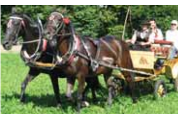
Konjska vprega je bila in pridne gospodinje - vse iz Senožet.

Vse, kar so Plamenke zamešale in spekle, so tudi prodale.