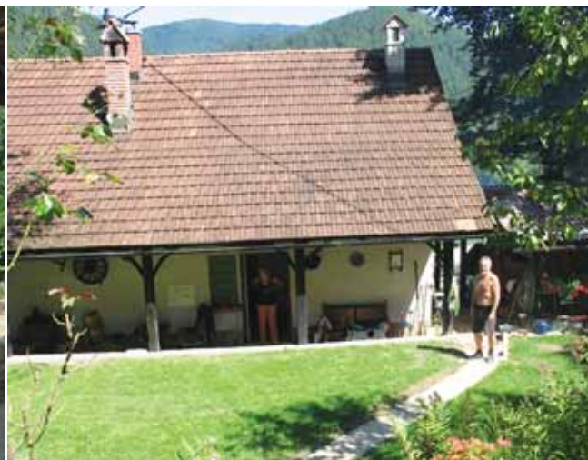
Okolje hitreje okreva kot človek. Strah pred deževjem ostaja.